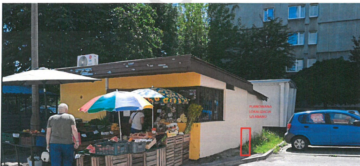
Fot.1. Planowane posadowienie szlabanu przy ul. Słonecznej.