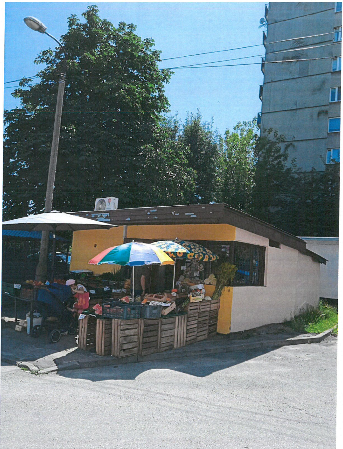
Fot.3. Napowietrzna linia kablowa nad kioskiem.