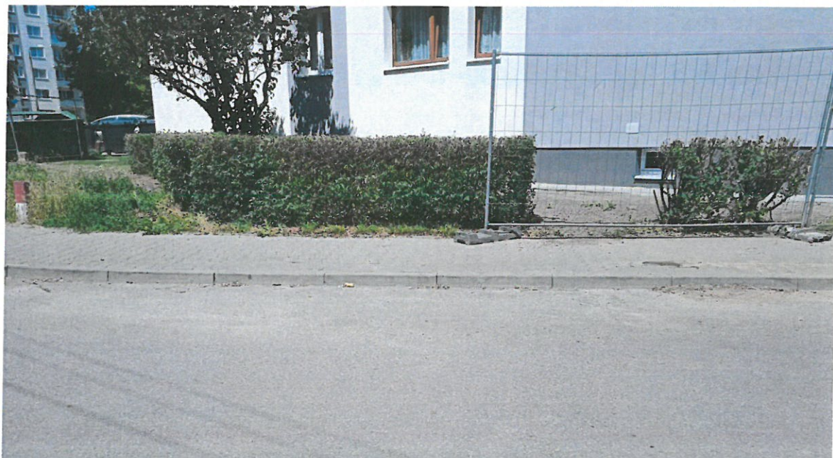
Fot.2. Budynek, z którego należy wyprowadzić zasilanie dla szlabanu.